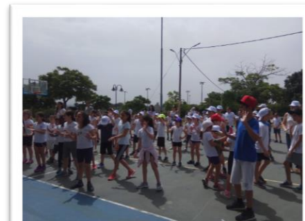
אירוע שנתי במגשימים